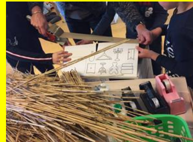
Rietdekken in groep 4/5/6

Al met al een hele leerzame week en een onvergetelijke ervaring!