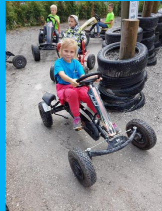
Schoolreisje Dinoland Zwolle

We stellen een open en directe communicatie met ouders en verzorgers erg op prijs. Heeft u een vraag of opmerking, aarzel dan niet om even binnen te lopen. Wilt u een langer gesprek met de leerkracht of directie dan is het verstandig om een afspraak te maken.