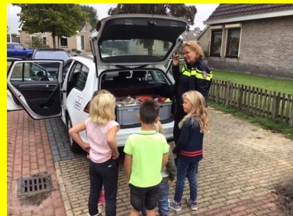
Bezoek wijkagent in groep 1/2/3