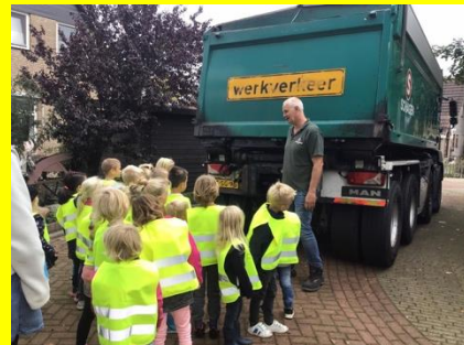
Gastles Schagen Infra