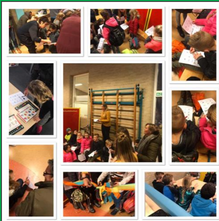
Het nieuwe leerplein