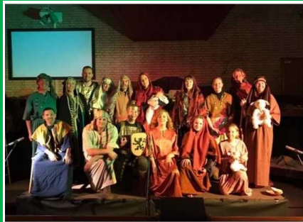
De kerstmusical: 'De herberg zit vol!'