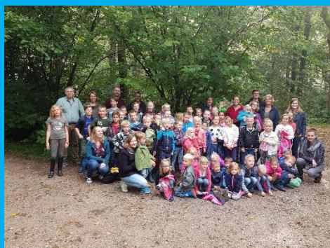
Eben Haëzerdag 2017