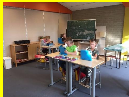
Aan de slag in groep 5 & 6

Heeft u al een kijkje genomen op onze nieuwe website www.ebenhaezer-meilan.nl ?