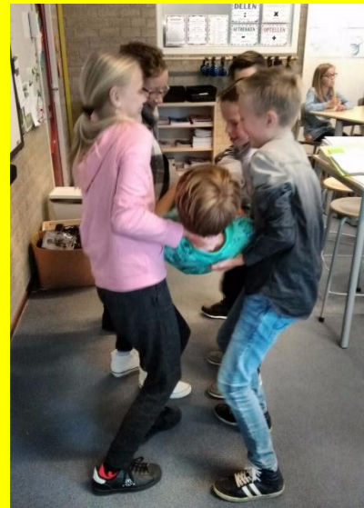
Kanjertraining in groep 7/8