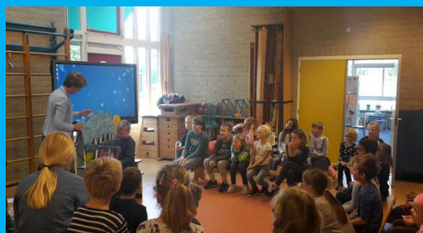
Opening Kinderboekenweek 2017