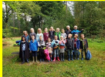
Groep 3 & 4 op vleermuissafari